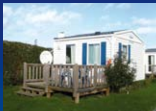
MOBIL-HOME 2 PERSONNES (Super Astria) - 1 CHAMBRE

Etant donné le nombre de modèle et de marque de locatifs que nous possédons nous vous proposons sur ces deux pages une gamme élargie mais non exhaustive de nos possibilités d'hébergement.